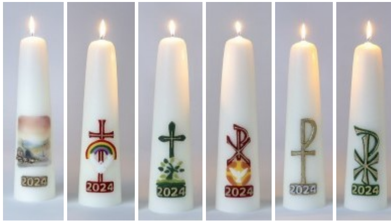
A B C D E F

A De Verrijzenis, B Duif met Regenboog, C De Levensboom, D Vredesduif, E Staurogram, F Chi-Rho Kruis.