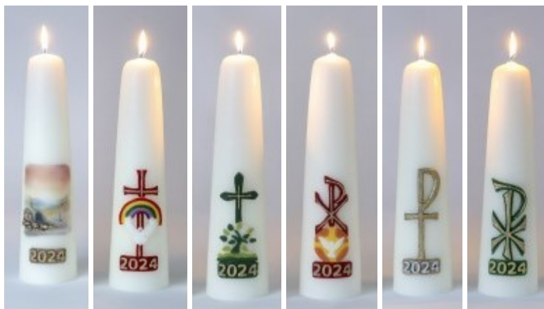
A B C D E F

De Paaskaars die in de paasavondwakedienst van 30 maart 2024 zal worden aangestoken is de kaars A met de afbeelding van De Verrijzenis.